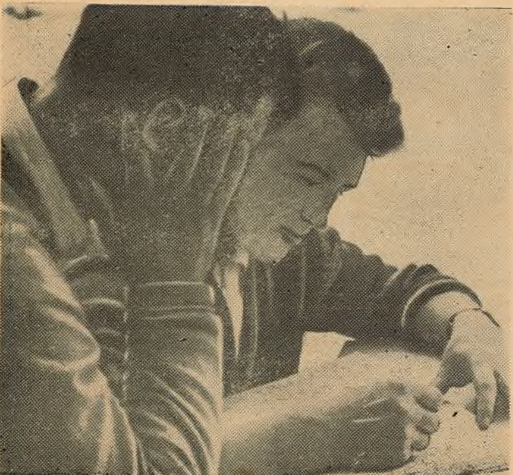
АПОШНЯЯ КАНСУЛЬ І АЦЫЯ...